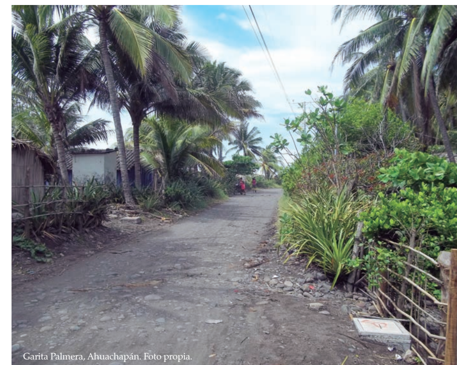
Garita Palmera, Ahuachapán.

De acuerdo con los datos estadísticos tanto de la DGME y de la Secretaría de Gobernación de México, se comprobó que del año 2013 al 2015 las deportaciones de mujeres salvadoreñas se han incrementado en más de 100 %, como se mencionó al inicio de este escrito.