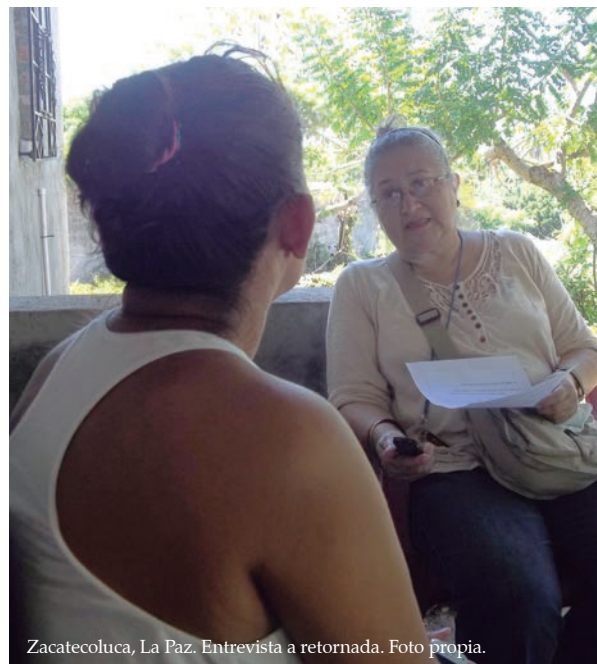
Zacatecoluca, La Paz. Entrevista a retornada.

El trabajo de campo se realizó a través de entrevistas semiestructuradas a mujeres con experiencia migratoria (deportadas, retornadas voluntarias y en proceso de regularización en EUA) en los departamentos de San Salvador, Ahuachapán, Sonsonate y La Paz.