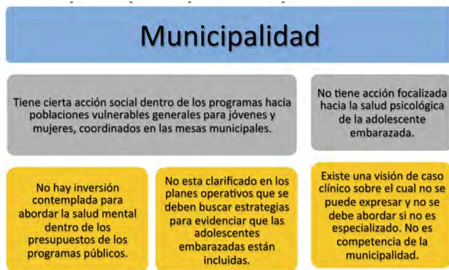
Figura 2: Modelo de atención de la salud mental en los territorios mediante la aplicación de las políticas públicas por las municipalidades

Nota: figura elaborada a partir de los resultados encontrados.