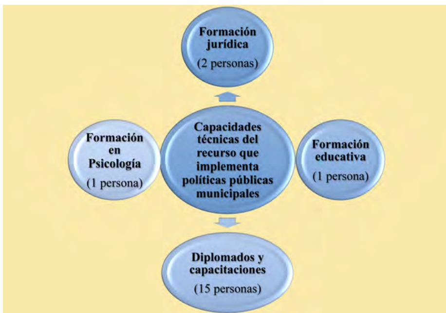
Figura 3. Formación de competencias técnicas y académicas del funcionario que coordina proyectos municipales en los que podría incluirse la adolescente embarazada

Nota: figura de elaboración propia a partir de los resultados de esta investigación.