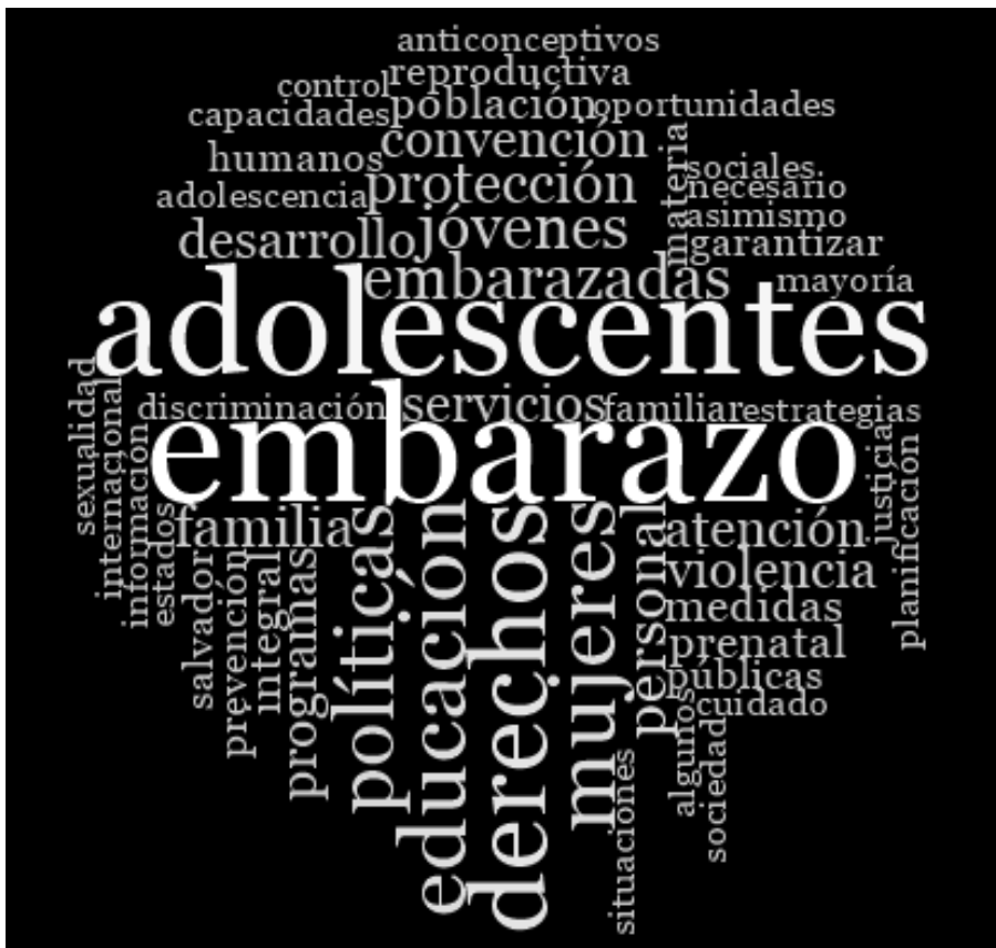
Figura 1. Conceptos utilizados en los discursos que se manejan en las acciones de las políticas públicas implantadas en los municipios participantes

Los retos de la maternidad en las acciones públicas son diversas, cada área que integra a la adolescente embarazada dentro de los territorios se ve comprometida; y en los discursos de los actores clave se encuentra la ausencia de la atención a la salud mental (ver figura 1).