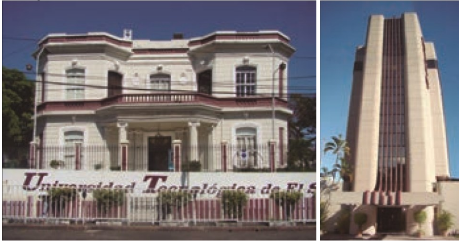
Fotografías 1 y 2 : imágenes que muestran la diferencia entre el nuevo edificio de Los Fundadores , y el edificio Anastasio Aquino , casa de principios de siglo XX que actualmente alberga al MUA.