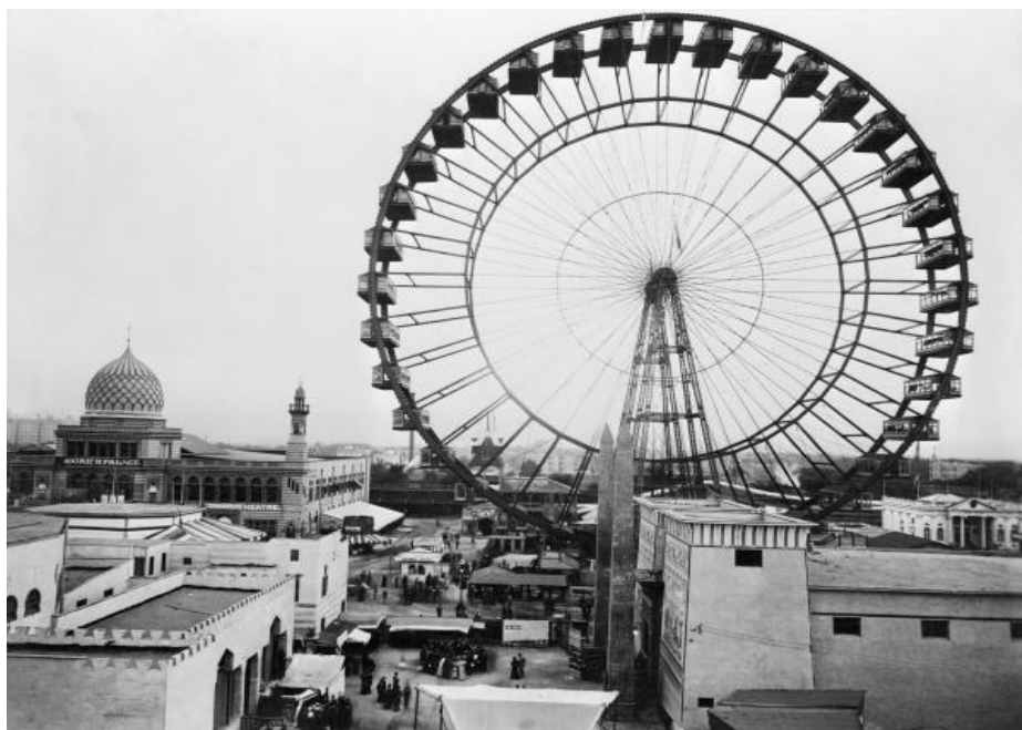
Imagen 5. La Rueda de Chicago en el centro del centro ferial, en la exposición mundial de 1893.

El entusiasmo por la exposición fue tal, que su catálogo oficial afirma que, después de la misma, el mundo entero estará dividido en dos grandes clases: los que vinieron a la feria y los que no asistieron.