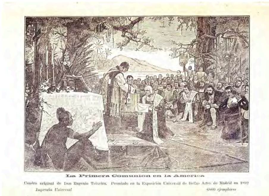
Imagen 4. Reproducción de la pintura La Primera Comunión en América.

El texto es muy complaciente e insiste en rendirle pleitesía a la audiencia, sobre todo porque esta audiencia incluye al Rey de España. El texto construye discursivamente una serie de retratos o descripciones que apuntalan vasallaje, rebeldía, capitulaciones y acuerdos. El autor se definía a sí mismo como haciendo fuerzas de mis flaquezas, débil, disminuido (...) hijo allende del mar, mientras declaraba que hablaba en nombre de los americanos. Colón es retratado entre tanto como astro sublime, inmortal, intrépido Genovés, amparado por la Corona de España. En este punto se hace presente una pequeña tensión en el intrépido Genovés, pues una de las discusiones candentes en el contexto de las celebraciones es la nacionalidad no española de Colón y por lo tanto la deslegitimación del reclamo español del descubrimiento.