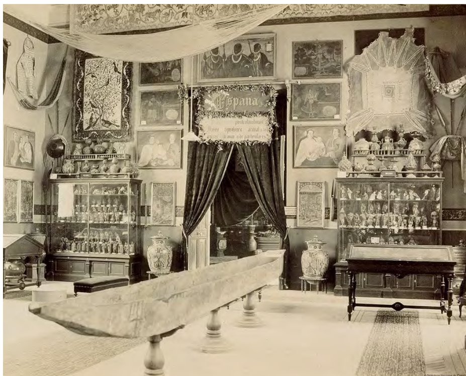
Imagen 1. Sección del montaje presentado por España.

España además presentó una sección denominada "geológico minera", en la que se presentaron objetos de los nuevos Estados en los cuales se había dividido el "vasto territorio que perteneció a España" en especial México, Bolivia, Perú y Chile. La colección mineralógica, geológica y paleontológica de Cuba y los objetos de Filipinas, se presentaron aparte para dar énfasis a la posesión de España sobre estas tierras. Esta sección no sólo se compuso de "objetos minerales" sino también de mapas y "los tanteos geológicos" realizados en Cuba, Puerto Rico y Santo Domingo.