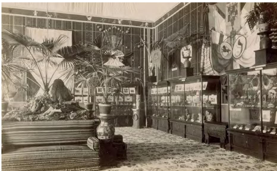
Imagen 2. Instalación de Guatemala para la Exposición Histórico- Americana de Madrid 1892.

El texto evoluciona sin sobresaltos importantes hasta que se hizo referencia al tema indígena. El componente indígena de su población - dos terceras partes más una tercera parte de ladinos – se constituye en un elemento de tensión en el marco de una cultura neocolonial europea fuertemente racista del siglo XIX. En el catálogo de Guatemala, el pasado precolombino se encuentra asociado al reino náhuatl de los Cachiqueles el cual le dio nombre al país (quauhtemalan). Al hacer referencia al idioma se percibe una serie de tensiones importantes, pues en ningún momento se indica cual es la lengua más hablada, solo se señala que el idioma nacional es el castellano, y por otro lado “los indios, aunque casi todos hablan el español, conservan entre sí el uso de sus lenguas primitivas, como son el maya, el quiché, cachiquel, zathil, etc, etc” [ sic ] (Sucesores de Rivadeneyra, 1893, p. 13).