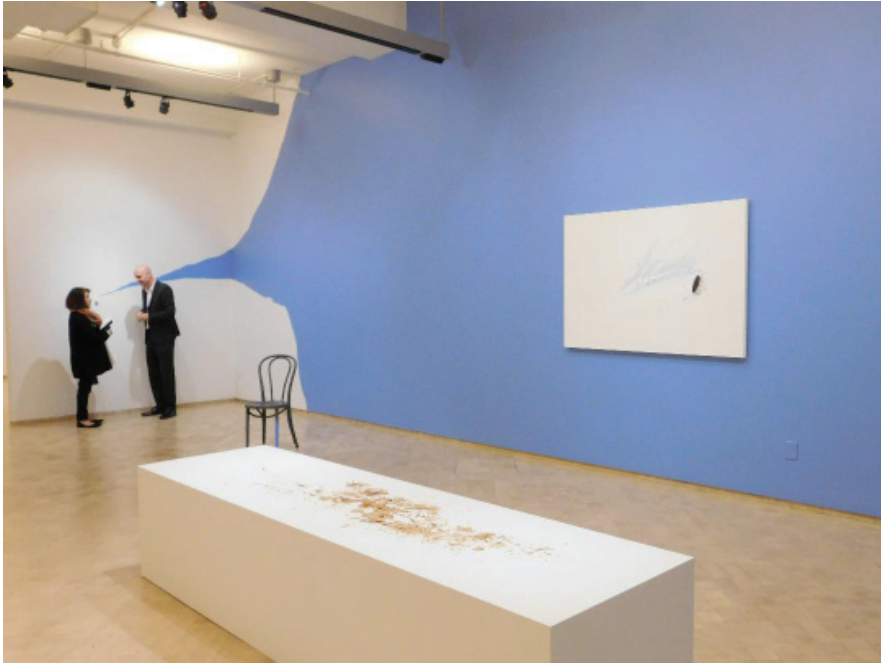
El Museo del Barrio reabre sus puertas.