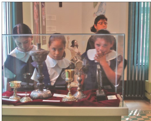
Sala temporal, MUA

En tiempos recientes el concepto de museo no solamente ha sido cuestionado, sino también ha venido cambiando, de ser una institución ensimismada, cerrada, a una más dinámica y colaboradora con otras instituciones dedicadas a la educación y la divulgación de valores de cambio en la sociedad moderna (llámense escuelas, institutos, universidades o ministerios de educación pública).