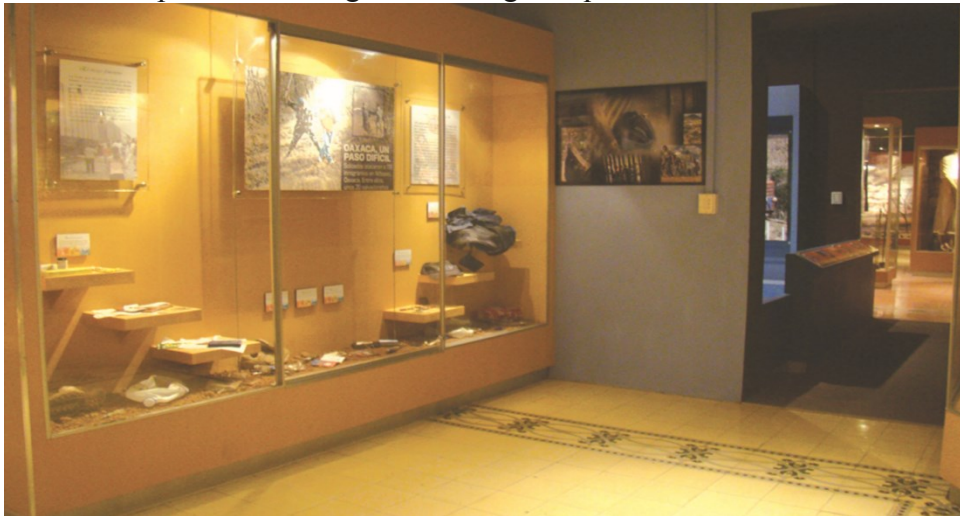
Sala "Las migraciones", MUA

Si se habla de que el museo no solamente debe conservar una colección determinada, sino también en su entorno; es decir, una zona o una localidad. Entonces, la labor del museo debe de ser la de conservación del patrimonio local. Pero ¿cuál es ese patrimonio por conservar? ¿Es solamente el patrimonio arquitectónico? ¿Qué pasa con el patrimonio humano, social, con sus anécdotas, elucubraciones, preocupaciones cotidianas?... ¿De qué manera un museo inserto en un sector con mucha afluencia humana, con problemas sociales y económicos, puede tanto reflejar como contribuir al desarrollo de esa zona? ¿Qué valores debemos de fomentar en la comunidad para hacer del lugar uno que sea ejemplar o, por lo menos, más tranquilo y atractivo para el visitante extranjero? Las exposiciones actuales no solo deben de tener un grado de academicismo o desarrollo de contenidos científicos, sino también han de estar dirigidas en sus temáticas a la gente que habita el entorno del museo. 2 Es necesario definir y delimitar el patrimonio tangible e intangible que el mu-