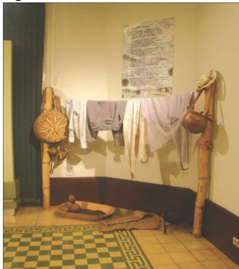
Sala temporal MUA

Sin embargo, estos países fueron los primeros en cuestionar el concepto tradicional de museo , y comienzan a darle rumbos más didácticos a las exposiciones y discursos museográficos, así como a extender la promoción cultural hasta el punto de crear la que hoy es una de las más rentables industrias en el mundo: el turismo cultural. Gracias a esta industria aprendemos lo que ellos designan como arte y cultura , y lo que no lo es. Nos ubicamos dentro del panorama mundial de la cultura como pueblos tercermundistas, con una cultura “atrasada” al compararnos con sus logros estéticos; obtenemos cánones estéticos de estas instituciones