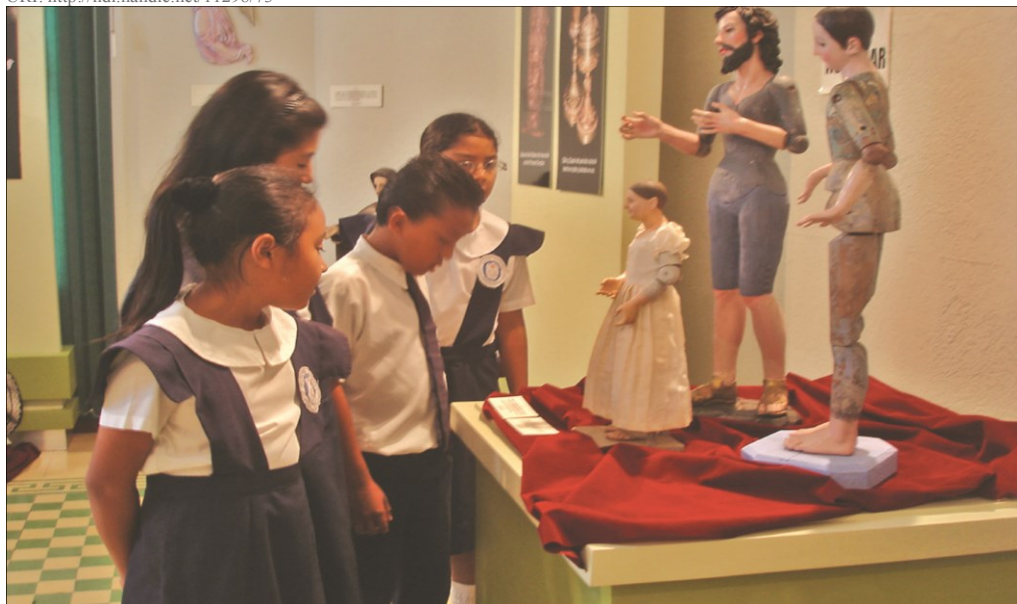
Sala Temporal, MUA