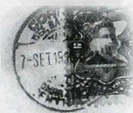
Detalle de un sello postal de los primeros años del siglo XX

7- La historia tradicional está hecha por profesionales. Es más, ya hemos hablado de que el siglo XIX es el de la profesionalización de la historia, se instaura como saber universitario. Los historiadores de la nueva historia también son profesionales pero a diferencia de los otros buscan