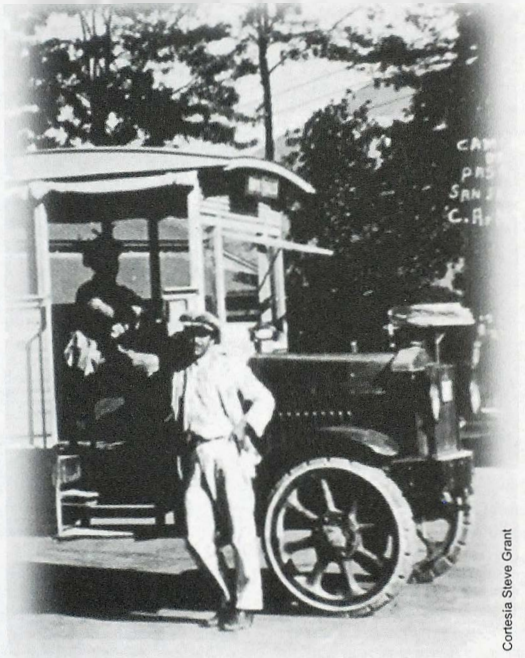
¡Detalle de postal que muestra un antiguo ejemplar de transporte colectivo

Y es que ya se ha manifestado en muchas ocasiones el carácter conservador de las facultades de historia. A modo de ejemplo, los dos ámbitos de estudio más dinámicos en cuanto a debate teórico en ese momento, la historia del género y el tema amplio y complejo denominado historia de la escritura (18) no tienen prác-