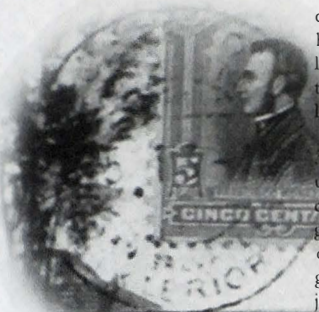
Detalle de un sello postal de principios del siglo XX

del cuerpo, de la locura, de la higiene, de la violencia, de la lectura y de la escritura; de todos los grupos sociales incluyendo los excluidos, los invisibles, los de abajo, las mujeres, los hombres, los niños. La historia tradicional era nacional ahora también es mundial, local e incluso micro. (12) Y es factible hacer historia de todo esto porque la nueva historia se afirma sobre el fundamento filosófico de que la realidad está social y/o culturalmente constituida. Este relativismo cultural altera la definición de la historia tradicional de lo que es central y periférico, de lo que es principal y lo que es secundario.