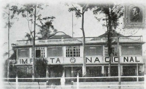
Postal donde puede apreciarse el primer edificio de la Imprenta Nacional

4- La historia tradicional utiliza como únicas fuentes los documentos oficiales de los archivos para la identificación de los hechos históricos. Hasta tal punto las fuentes definían la historia que estableció el límite entre