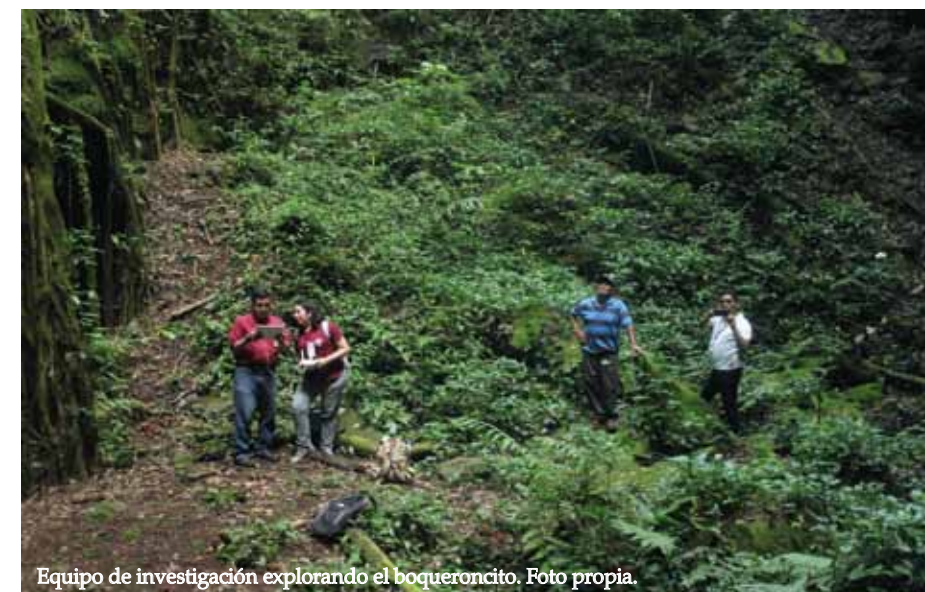
Equipo de investigación explorando el boqueroncito.

huyeron de la erupción que ahora viven en áreas como San Martín, Apopa y Ciudad Delgado, entre otras.