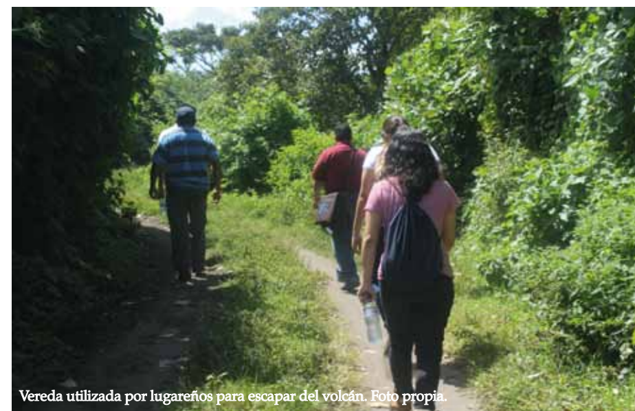
Vereda utilizada por lugareños para escapar del volcán.

Se logró recabar varias tradiciones orales, entre las que se encuentra “el bolo guía”, “la cruz milagrosa”, “el chino quemado”, entre muchas otras que se encuentran en la versión completa del informe de investigación.