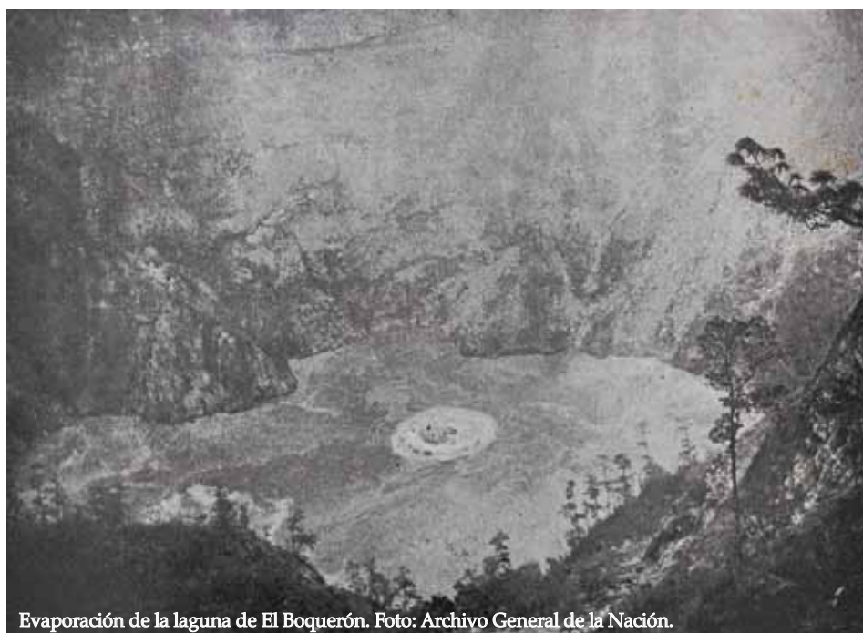
Evaporación de la laguna de El Boquerón.

Originalmente fue un lago volcánico, su cráter se secó con la erupción de 1917, descubriendo la formación que ahora constituye el pequeño cráter central, dándole su forma actual. De acuerdo con el historiador Jorge Lardé y Larín (2000), “no se conocen referencias de su presencia durante la colonización española por algún cronista, sino hasta 1807 cuando el Intendente Antonio Gutiérrez y Ulloa hizo mención de una pequeña laguna, árida en sus márgenes y formada de aguas azufrosas”.