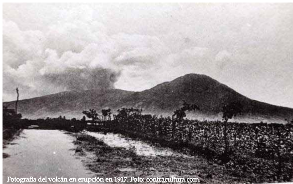
Fotografía del volcán en erupción en 1917.

Esta investigación fue auspiciada por la Universidad Tecnológica de El Salvador con el propósito de contribuir a la celebración de los cien años de la erupción del volcán de San Salvador, que sucedió en 1917. El documento recopila elementos de tradición, historia oral, actividades económicas e información general sobre los habitantes de los municipios y cantones que comparten el volcán de San Salvador. Se trató de un estudio de carácter monográfico, con aplicación de técnicas etnográficas, como la observación participante y la entrevista semiestructurada, así como de la revisión de fuentes documentales, tanto escritas como fotográficas. El estudio se llevó a cabo durante los meses de febrero a diciembre del año 2016, en los municipios de San Salvador, Santa Tecla, Quezaltepeque, Nejapa y San Juan Opico. Como principales resultados se logró compilar leyendas y tradiciones orales propias de los habitantes de los cantones aledaños al volcán, se identificó y sistematizó la práctica de creación de carbón vegetal como parte de los procesos económicos locales y se registraron testimonios de diferentes autores sobre la erupción del volcán.