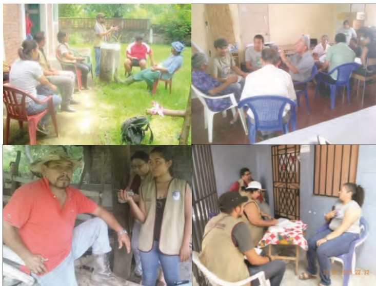
Figura 3. Levantamiento de datos con los informantes claves en cada municipio. Las primeras fotos refieren a los focus group realizados por los estudiantes en los municipios de Santiago Nonualco y San Pedro Nonualco; las de abajo representan las entrevistas en profundidad con informantes claves de San Juan Nonualco.