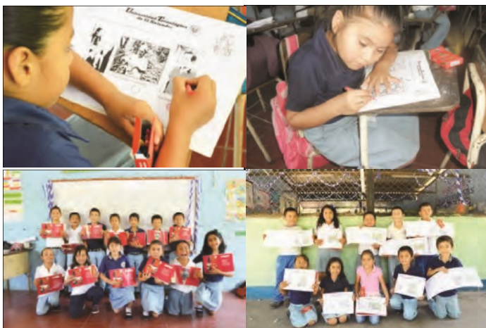
Figura 5. Proceso de difusión y socialización de los resultados con los estudiantes de primer ciclo de los centros de estudio municipal. Fotografía, tomada, por Carlos Osegueda y Luis Roberto Pérez (2015).