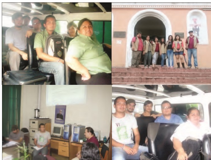
Figura 1. Conformación de equipos de investigación de la escuela de Antropología y planificación del proceso de proyección social.

La segunda forma de cómo se integran los grupos de proyección social es la más asertiva, y los estudiantes se comprometen a iniciar hasta terminar los procesos a largo plazo; sin embargo, hay que tomarle la palabra a la alumna citada en su recomendación y buscar más formas de convocar a los estudiantes para que experimenten dichos procesos.