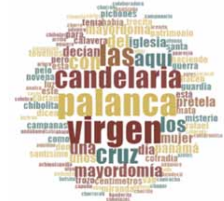
Figura 3. La religiosidad y espiritualidad ostumeña

En la figura 3 se puede apreciar que, dentro de la nube de palabras, respecto a la religiosidad, que se comprende como todas aquellas prácticas y concepciones teóricas, ritualistas y míticas, dentro de un sistema de creencias, que son asumidas a escala individual y colectivo y que son proyectadas a nivel tangible e intangible, permitiendo codificar el sentido de pertenencia y a la vez de exclusión de un grupo sociocultural con respecto a otro, linda entre lo mágico-religioso y lo profano, y la espiritualidad (referente a las vivencias de la población de acuerdo con su entorno