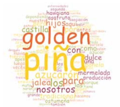
Figura 1. Palabras más frecuentes de coincidencias exactas sobre la productividad agrícola y papeles de género en Santa María Ostuma.

La nube de palabras refleja que entre las opiniones de los entrevistados es la piña el producto por excelencia en el municipio, destacando también sus variedades, como la piña Golden y la de azúcarón; la llaman patrimonio ostumeño ; el sentido de pertenencia se da tanto por el tipo de piña como por el sentimiento de arraigo y pertenencia de grupo, además se menciona la piña de Castilla y la hawaiana, destacando además los tiempos de cosecha de verano e invierno y, en menor medida, se entrelaza este producto con la organización social local en torno al fruto (Asafrutos y Appes).