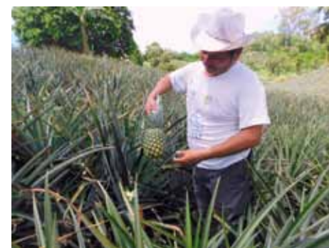
Fotografía 1. Agricultor de la finca ecoturística Santa Elena, cantón El Carrizal, mostrando un ejemplar del cultivar Golden MD-2.

sociocultural) de la villa ostumeña, se pone de manifiesto que en el pensamiento y comentarios de los entrevistados existe una gran devoción a la Virgen de Candelaria, que en el imaginario individual y colectivo se mantiene latente y llena de gran fervor católico. En torno a ella, hay un sinnúmero de manifestaciones de fe y de organización social, que se ven entrelazadas, como por ejemplo, las mayordomías, cofradías y romerías, entre otras.