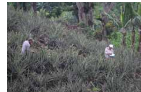
Fotografía 3. Vista de un piñal en su proceso de fertilización ubicado en el barrio Las Delicias, en Santa María Ostuma.

Las palabras que más mencionan los pobladores que están relacionados con memoria histórica ostumeña , que tiene una íntima relación con el concepto de las historias de vida, ambos conceptos están asociados de forma dependiente con el concepto principal, que en este caso pertenece a historia. Esto se puede interpretar como que el concepto memoria histórica ostumeña y las historias de vida de algunos informantes claves consultados se relacionan como parte vital de la historia general del municipio.