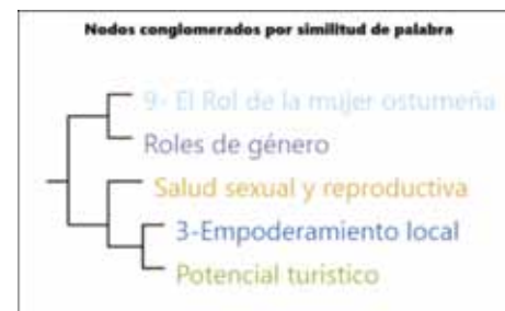
Figura 2. Análisis del rol de la mujer y el emprendimiento local

Al hacer el desglose de las relaciones identificadas mediante la agrupación de nodos de significado, el empoderamiento local y el potencial turístico aparecen como nodos independientes del concepto principal, que en este caso se refiere a las categorías de salud sexual y reproductiva. Esto se puede interpretar como que, en el caso de la mujer ostumeña, se asocia con el esfuerzo de participar de forma empoderada a niveles comercial, político y organizacional, con posibilidades incidir en el desarrollo turístico siempre y cuando se apropien de una cultura consecuente con la salud sexual y reproductiva; más planificada, de tal forma que contribuya a asumir papeles de género más equitativos, que les permita a las mujeres lograr ser más protagonistas en la vida institucional, comercial y turística; para que no sean limitadas a un papel secundario o solo sean vistas como procreadoras de la vida y con responsabilidades domésticas en el hogar.