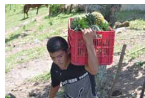
Fotografía 2. Joven recolector de piña Golden.

Por otra parte las expresiones culturales y la religiosidad popular están asociadas como nodo dependiente del concepto principal, que en este caso pertenece a ritualidad. Esto se interpreta como que las expresiones culturales se asocian con el concepto de la religiosidad popular siempre y cuando esté mediada por la acción ritualista que se genera en ambas prácticas comunitarias.